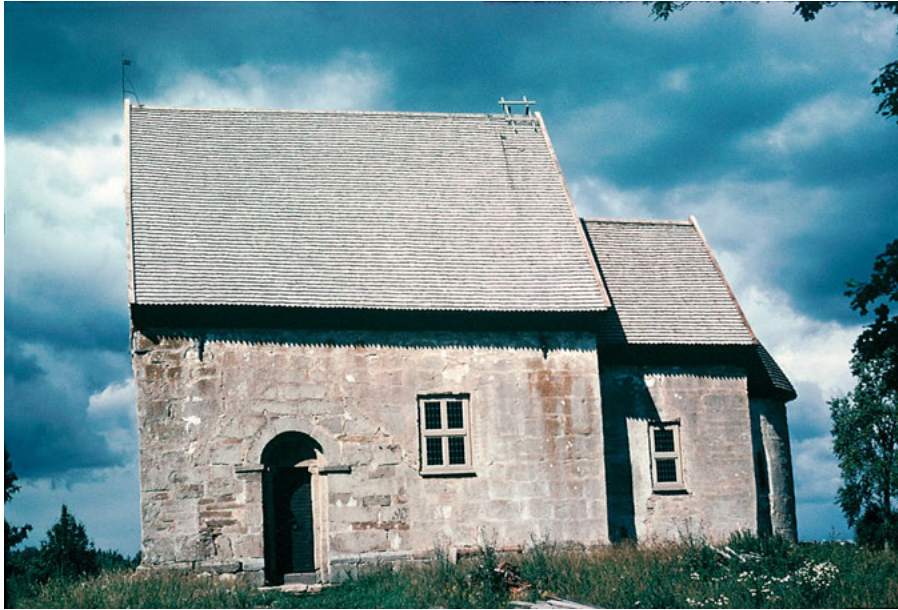
FIGUR 1. Den romanska kyrkan i Suntak. FOTO: Margareta Kempff Östlind, 1985.

matiska aspekter. För att idén om arkitektur som budskap i denna bemärkelse skall fungera, krävs att monumentets ”mening” reduceras i både socialt, ideologiskt och kronologiskt hänseende: socialt i det att det endast är en individ eller grups (initiativtagarens) handlingar som framhålls, ideologiskt genom att det endast är denna grups värderingar som beaktas, och kronologiskt i det att det endast är monumentet i dess ursprungliga gestaltning som är intressant. Problemet är dock att monument sällan är entydiga eller lätta att tolka. Det finns otaliga sätt på vilka en kyrkobyggnads symboliska uttryck kan kombineras och skapa mening, och monumentet är därmed öppet för en lång rad tolkningar. Mottagaren behöver alltså ingalunda ha uppfattat kyrkobyggnadens ”budskap” på det sätt som avsändaren avsett. Därtill bör fogas att uppförandet av även den ringaste stenkyrka är ett projekt som löpt över flera år, och involverat en stor mängd människor i olika kapaciteter, som rimligtvis bör ha gjort sig tankar om meningen av det byggnadsverk man uppförde.